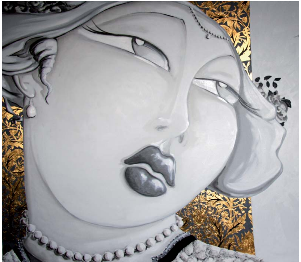
Lucrezia Borgia I 330x180 olio su tela e foglie oro 2009

In uno dei momenti più importanti del design e dell'arte Italiana a Verona, la settimana di "Abitare il tempo e ArtVerona 2009", Highlight propone una installazione originale " Home Armonia Concept", un percorso tra l'arte di Thomas Diego Armonia e la creazione di manufatti per l'arredo firmati dall'artista.